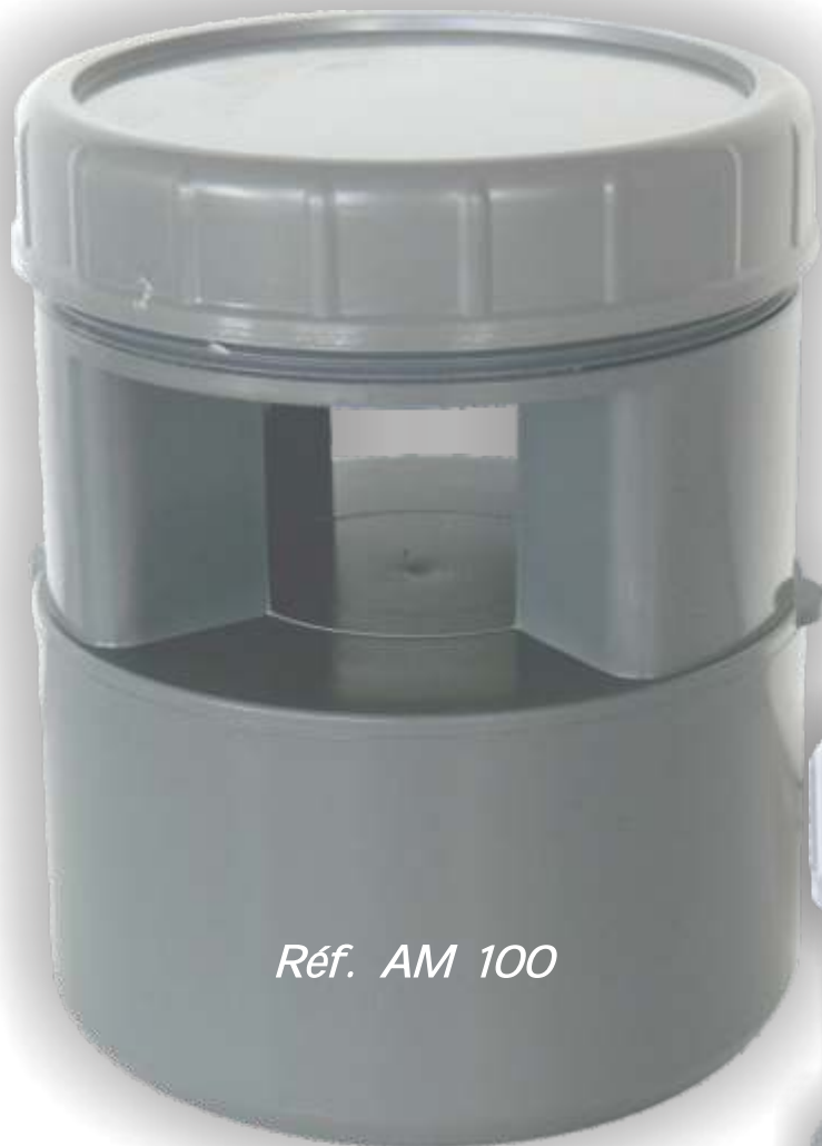
Réf. AM 100