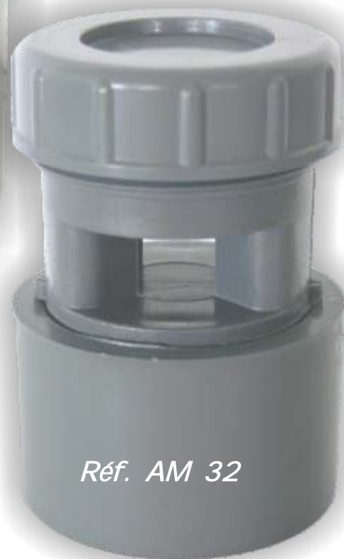
Réf. AM 32

UTILISATION : pour remplacer partiellement les ventilations primaires de chutes séparatives de l'habitat.